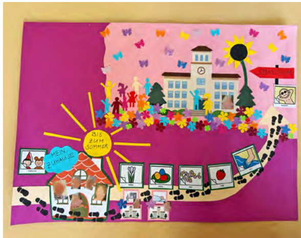
Collage von Sejla Perviz: «Dem Pflegekind mit einer Beeinträchtigung den Weg von der Übergangspflege in eine Institution erklären»